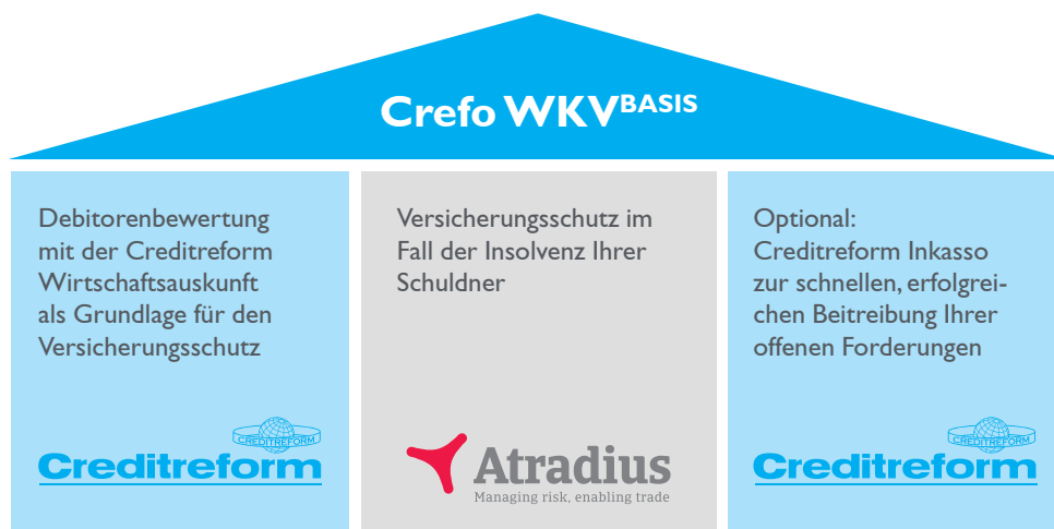
Bausteine der Crefo WKV BASIS

Durch Abtretung Ihrer besicherten Forderungen an Ihre Bank können Sie Ihre Verhandlungsposition zur Veränderung Ihrer Kontokorrentlinie stärken.